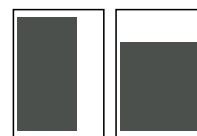
2/3 side 121,25 x 260 mm 185 x 173 mm