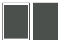
1/1 side 185 x 260 mm 210 x 297 mm