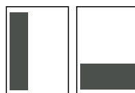
1/3 side 57,5 x 260 mm 185 x 86 mm